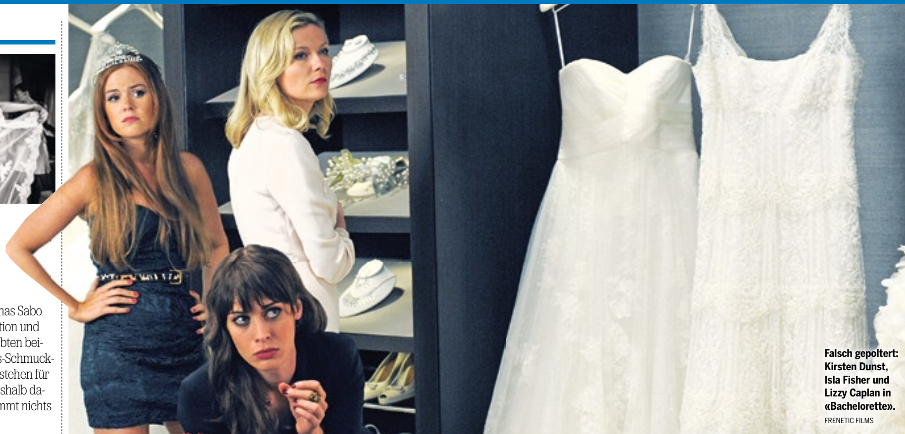
Falsch gepoltert: Kirsten Dunst, Isla Fisher und Lizzy Caplan in «Bachelorette».